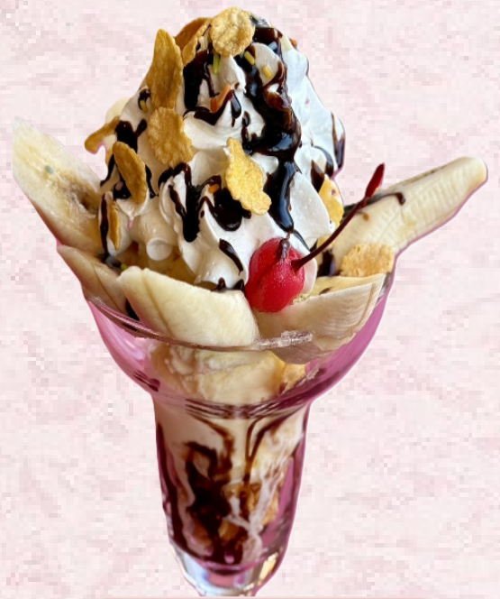
チョコバナナパフェ ¥900

※時期によりフルーツの盛り付け内容が変わります。 自家製県産 ぶどうアイス・桃アイス使用 基本 りんご・みかん・黄桃・パイナップル・バナナ +季節のフルーツ