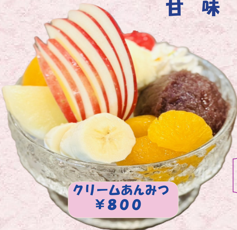
クリームあんみつ ¥800