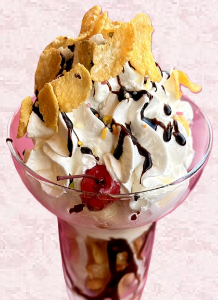
チョコレートパフェ ¥700