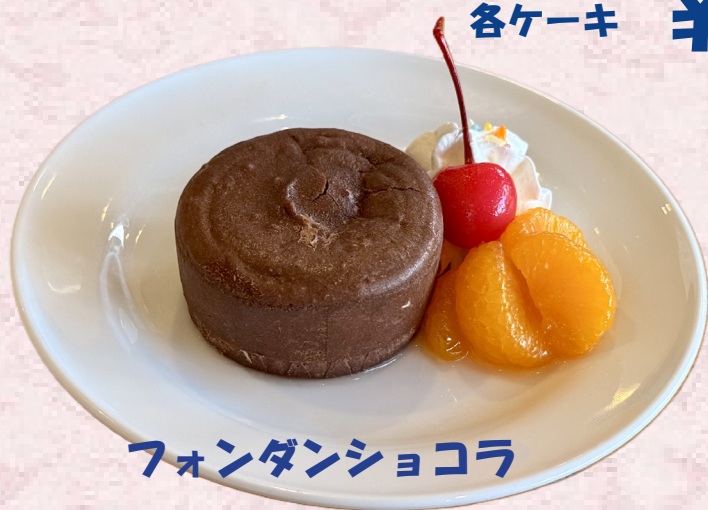
フォンダンショコラ