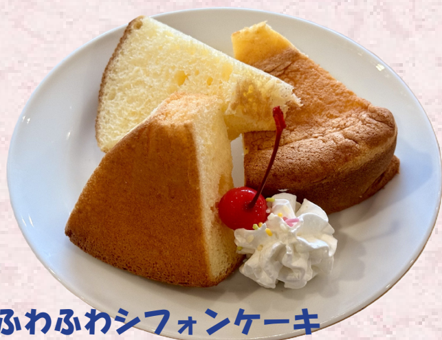
ふわふわシフォンケーキ