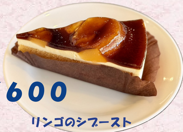
リンゴのシフースト