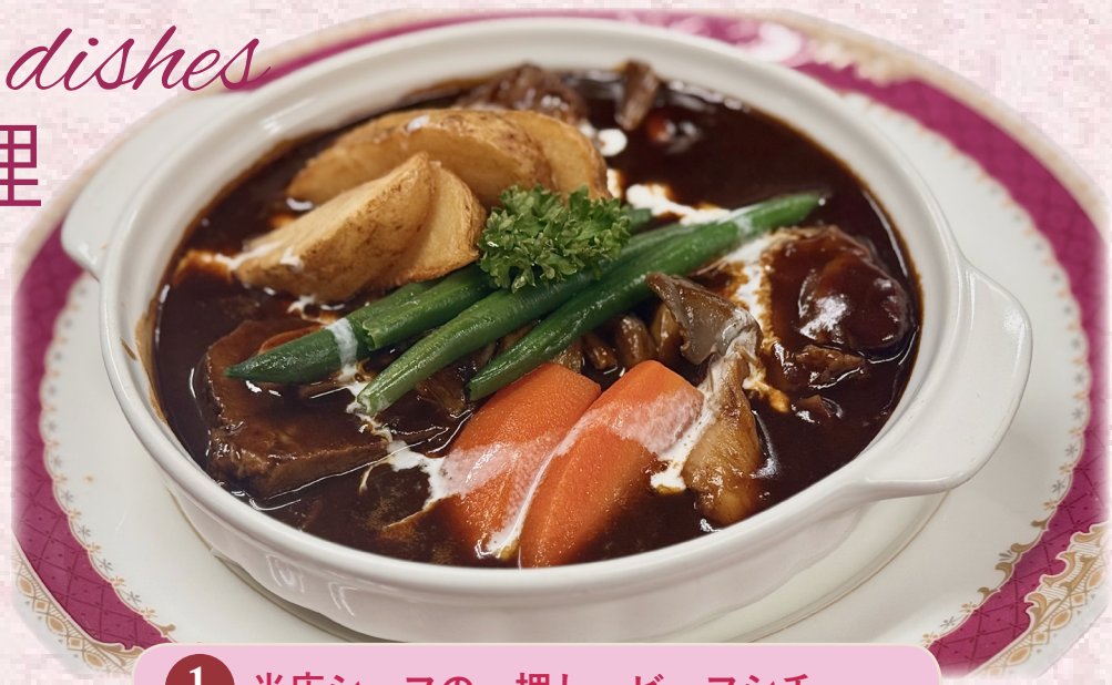
1 当店シェフの一押し ビーフシチュー