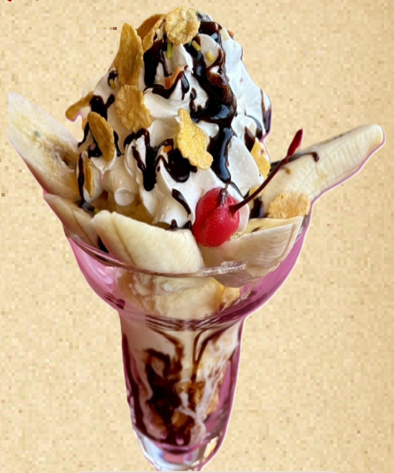
チョコバナナパフェ ¥900

※時期によりフルーツの盛り付け内容が変わります。 自家製県産 ぶどうアイス・桃アイス使用 基本 りんご・みかん・黄桃・パイナップル・バナナ + 季節のフルーツ