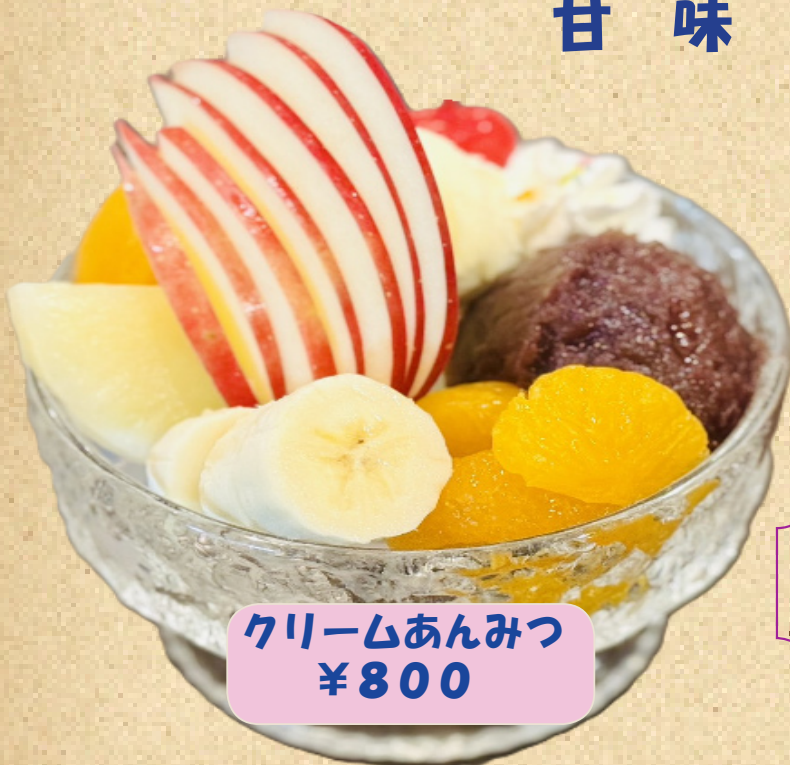
クリームあんみつ ¥800