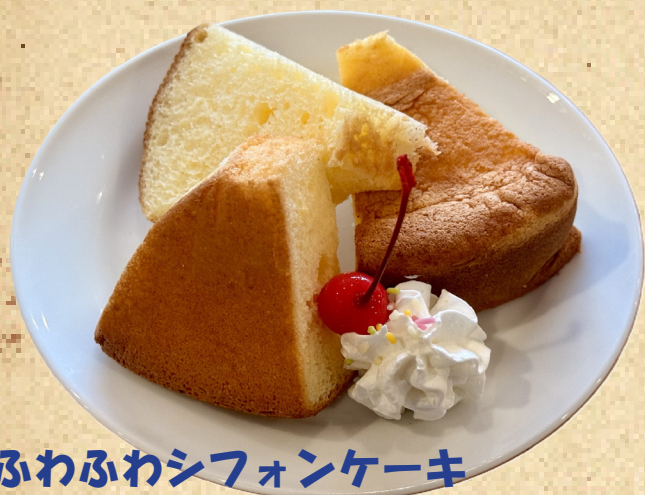
ふわふわシフォンケーキ