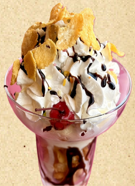
チョコレートパフェ ¥700